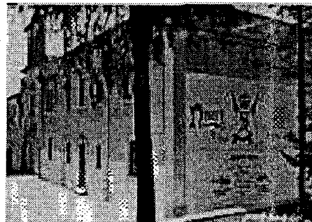
Ex orfanotrofio Don Orione