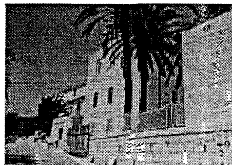
Casa di riposo "Boccone del povero"