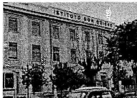
Istituto Don Orione