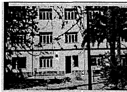
Villa S. Bartolomeo

Titolo Intervento RISTRUTTURAZ. E RIQUALIFICAZIONE FUNZIONALE DELLA VILLA S. BARTOLOMEO Comune CALTAGIRONE (CT) Finanziamento L. 790 milioni - Tot. Impegnato L. 790.287.183 - Tot. Pagato L. 790.287.183 Cofinanziamento L. 100 milioni Previsione Effettiva Inizio Lavori 01/10/98 24/09/98 Fine Lavori 30/07/99 31/12/99