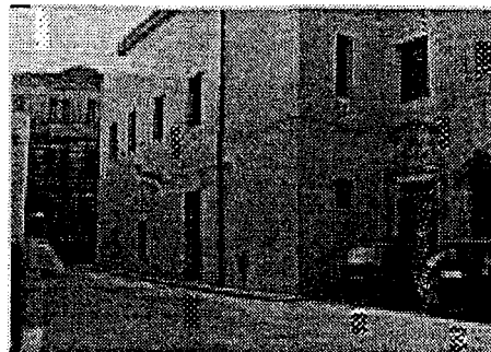
Ex Convento di S. Veneranda