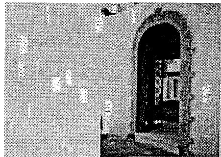
Catacomba di S. Giovanni e Cripta di S. Marziano