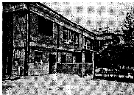
Oratorio parrocchiale di via Pareto