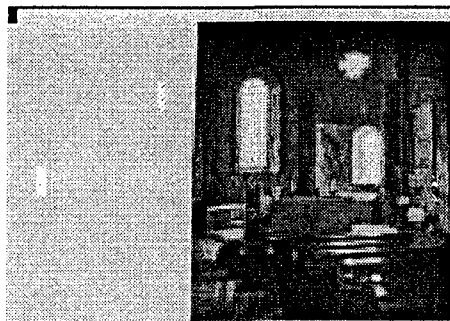
Cattedrale di S. Pietro

Titolo Intervento CATTEDRALE DI S. PIETRO IN MANTOVA PROGETTO PER IL RECUPERO DELL'IMMAGINE STORICA E LA CORRETTA ACCOGLIENZA LA NAVATA CENTRALE LA CUPOLA L'ABSIDE ED I TRANSETTI Comune MANTOVA (MN) Finanziamento L. 1.824 milioni - Tot. Impegnato L. 1.782.482.742 - Tot. Pagato L. 1.782.482.742 Cofinanziamento L. 210 milioni Previsione Effettiva Inizio Lavori 22/10/99 07/05/99 Fine Lavori 25/10/99 15/12/99