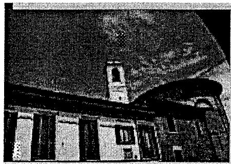
Chiesa di S. Luca

Titolo Intervento CONSERVAZIONE RESTAURO E ADEGUAMENTO AD USO LITURGICO CULTURALE DELLA CHIESA DI S. LUCA A PAVIA Comune PAVIA (PV) Finanziamento L. 1.248 milioni - Tot. Impegnato L. 1.240.991.753 - Tot. Pagato L. 1.116.892.576 Cofinanziamento L. 885 milioni Previsione Effettiva Inizio Lavori 11/06/97 11/06/97 Fine Lavori 31/10/99