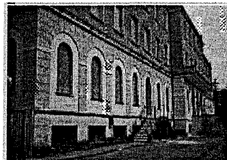
Edificio ex F.A.F.