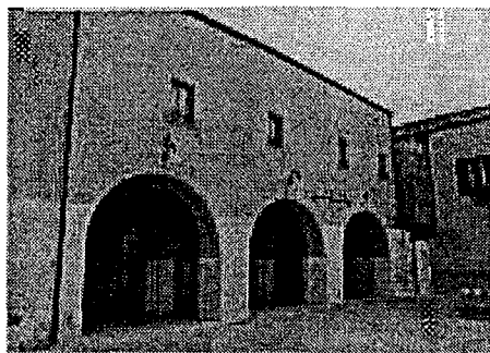
Complesso conventuale annesso alla Chiesa della SS. Annunziata