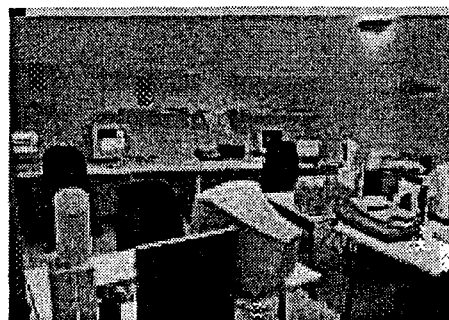
Progetto informatico e telematico per la gestione del flusso turistico e religioso