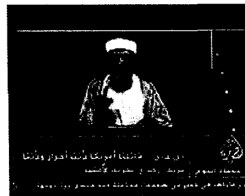
Bin Ladin directed his message at the American people

Following is the full English transcript of Usama bin Ladin's speech in a videotape sent to Aljazeera. In the interests of authenticity, the content of the transcript, which appeared as subtitles at the foot of the screen, has been left unedited.