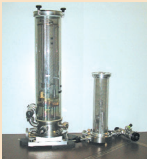
[1] Vecchio e nuovo gravimetro assoluto dell'IMGC-CNR. Comparison between the old and the new IMGC-CNR absolute gravimeters.

Absolute gravimeters: local acceleration due to the gravity measurements